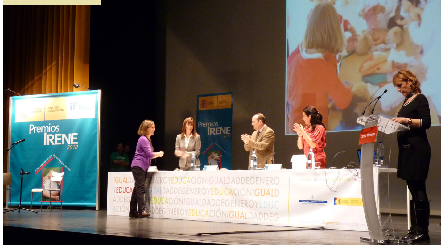
ACTO DE ENTREGA DE LOS PREMIOS IRENE.