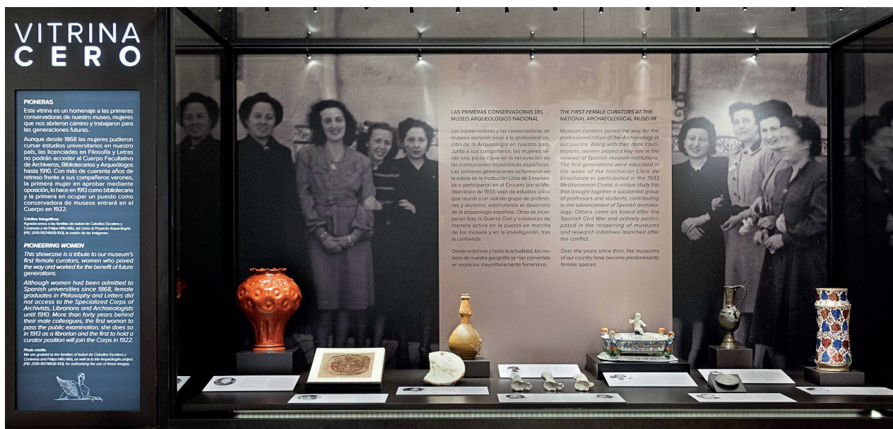
Fig. 1. Vista general de la vitrina dedicada a las pioneras del MAN.

Esta iniciativa se enmarca dentro de un doble eje. Por una parte, el Proyecto de Investigación ArqueólogAs de la Universidad de Barcelona, del que formamos parte las dos primeras firmantes de este texto y que busca, entre otros fines, rescatar la memoria de las primeras arqueólogas de nuestro país nacidas antes de 1950 a través de microbiografías que cuentan ya con más de 150 entradas 1 . Por otra, en la línea de recuperación de la agencia de las mujeres a la largo de la historia que constituye uno de los ejes prioritarios de actuación del MAN desde su reinauguración en 2014. Esta estrategia de visibilización de la mujer condujo ya a la renovación del discurso museográfico eliminando los sesgos androcéntricos previos, así como a la incorporación de recursos museográficos que han permitido desarrollar un discurso inclusivo. En los últimos ocho años se ha reforzado además a través de una agenda de actividades científicas y divulgativas encaminadas a rescatar las voces femeninas a lo largo de las distintas épocas (Moreno, 2012a, 2012b y 2021a).