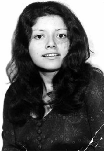
Mi mamá en 1974, un año después del Golpe Militar, cuando tenía casi mi misma edad y una de las pocas fotos donde aparece usando cabello largo.