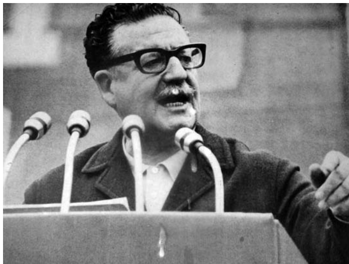
[C] "Ideología", acción de arte de Felipe Rivas.