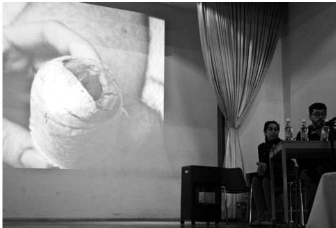
[A] Colectivo Garçons en exposición del Circuito “Por un feminismo sin mujeres”.