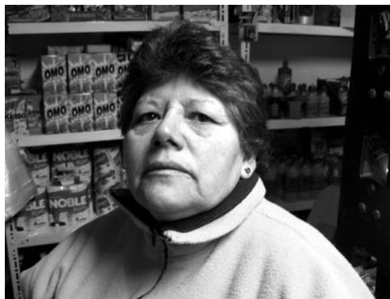
Fragmentos de mama drag (2010)

La figura del drag tiene sus límites en el espacio local, asimismo como sucede con el concepto queer . El drag no es ni siquiera una figura representativa desde los márgenes, si es que los márgenes pueden tener representación y si es que lo drag es una figura marginal, cuestión que pongo en duda. Justamente el problema aquí es la personificación de la identidad sexual o el sujeto sexual símbolo de la disidencia sexual; se trata de adscribir en un solo cuerpo un ideal de crítica posidentitaria, generando una re-normalización a través de un ideal de ser paródico, sólo asumiendo así la parodia del género –como una problematización que define a un sujeto– podríamos afirmar como Rosi Braidotti refiriéndose a los planteamientos de Butler que la “mímesis irónica no es una crítica”.