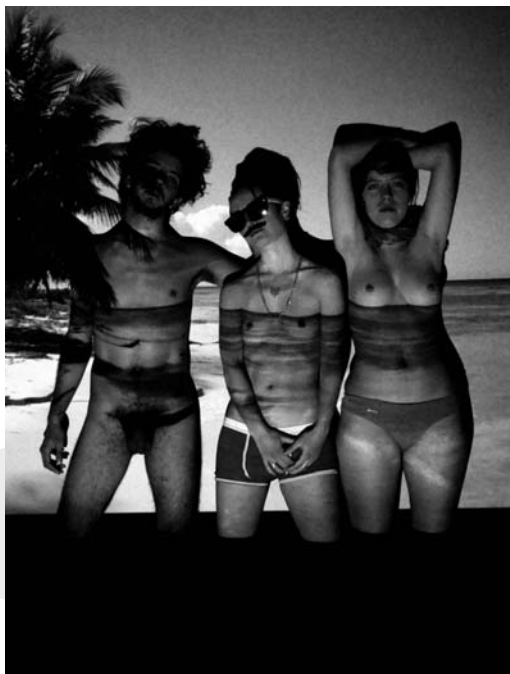
[D] Colectivo Subporno.