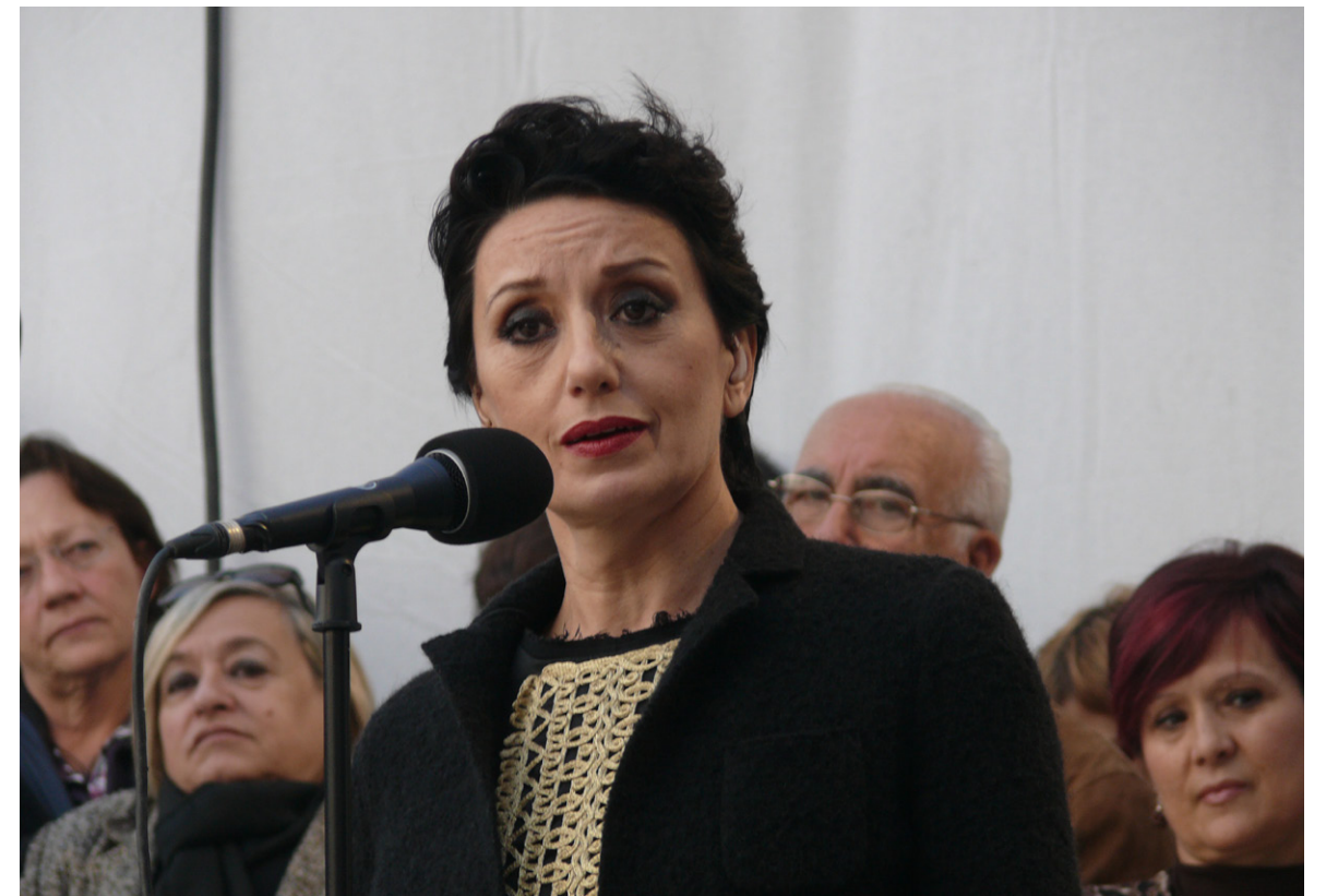
LA CANTANTE LUZ CASAL, DURANTE SU ACTUACIÓN EN EL ACTO.

EN EL ACTO SE GUARDÓ UN MINUTO DE SILENCIO EN EL QUE SE LEYERON LOS NOMBRES DE PILA DE LAS MUJERES QUE HAN SIDO VÍCTIMAS DE LA VIOLENCIA DE GÉNERO DURANTE ESTE AÑO