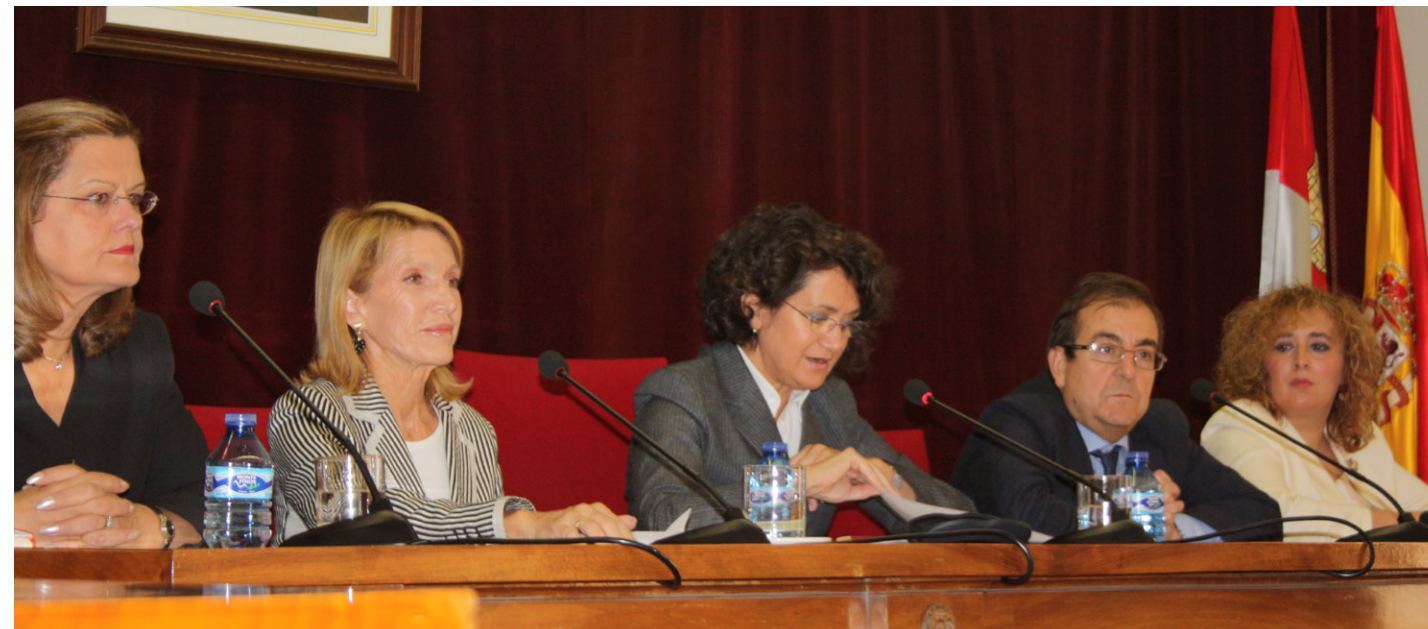
ACTO INAUGURACIÓN DEL MÁSTER EN LA UNIVERSIDAD DE SALAMANCA.