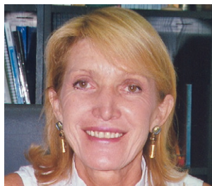
Teresa Blat Gimeno

DIRECTORA GENERAL DEL INSTITUTO DE LA MUJER